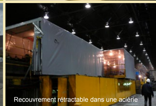
Recouvrement rétractable dans une aciérie

Contactez Chamtech pour plus d'information et pour votre soumission gratuite