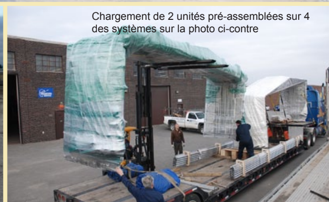
Chargement de 2 unités pré-assemblées sur 4 des systèmes sur la photo ci-contre

Le Rollcov-R MC a un excellent rendement sur investissement, en offrant un environnement contrôlé pour la cure de votre béton, en baissant les coûts d'énergie, en augmentant la sécurité des employé(e)s, et faire vos coulées à l'année longue, à l'intérieur comme à l'extérieur, et ce, à une fraction des coûts d'un bâtiments.