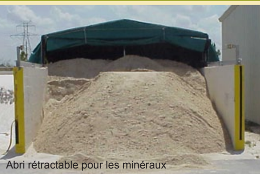
Abris rétractable pour les minéraux