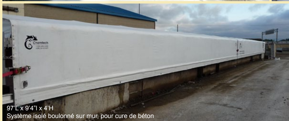
97'L x 9'4"l x 4'H Système isolé boulonné sur mur, pour cure de béton