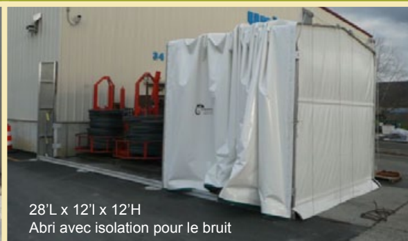
28'L x 12'l x 12'H Abris avec isolation pour le bruit