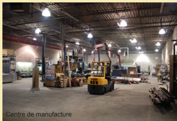
Centre de manufacture