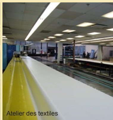
Atelier des textiles