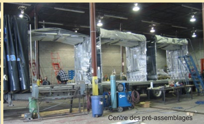
Centre des pré-assemblages