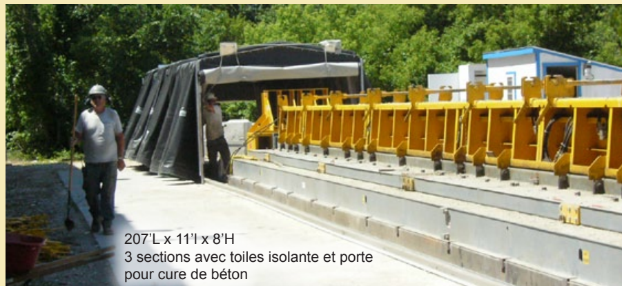
207'L x 11'l x 8'H 3 sections avec toiles isolante et porte pour cure de béton

Cette structure rétractable augmente l'efficacité du processus d'hydratation du béton