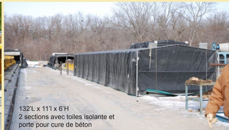
132'L x 11'l x 6'H 2 sections avec toiles isolante et porte pour cure de béton