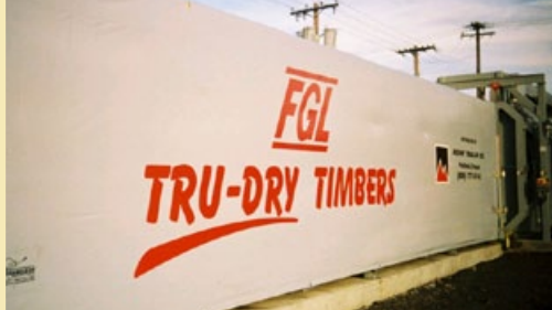
Séchoir à bois et autre matériaux

Et plus encore, visitez notre site web pour voir les différentes configurations et applications du Rollcov-R au www.rollcov-r.com/index-fr.html