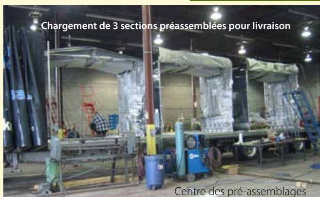
Chargement de 3 sections préassemblées pour livraison