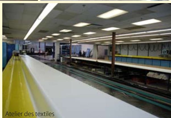
Atelier des textiles