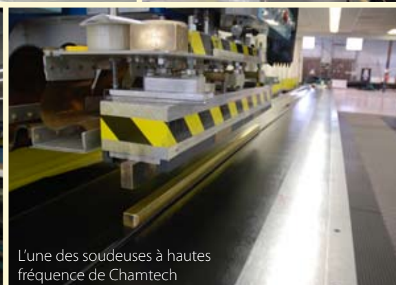
L'une des soudeuses à hautes fréquences de Chamtech

CONTACTEZ -NOUS POUR OBTENIR PLUS D'INFORMATION.